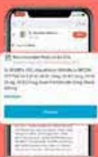
Konsultasikan dan ChatGPT untuk meredakan rasa sakit